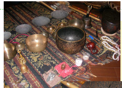
即興演奏に使用される数々の楽器(一部)。

※サイレント・セッションとソロ・コンサートを通して参加される場合、割引価格の7,000円になります。 ※お支払いは当日受付にてお願い致します。 ※各回 30分前より開場となります。