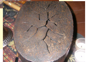
鉄で出来ているので、一見重厚そうですが、とても軽やかで澄んだ音がする「波紋音」。心が落ち着く音がする、と人気の楽器。